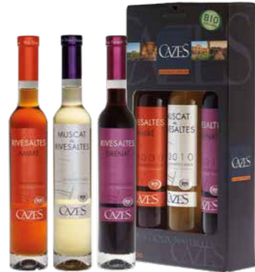
Cazes 37,5 cl Muscat de Rivesaltes Blanc, Grenat Rouge en Ambré in geschenkdoos

€ 38,72 pakketprijs excl. BTW € 46,85 pakketprijs incl. BTW