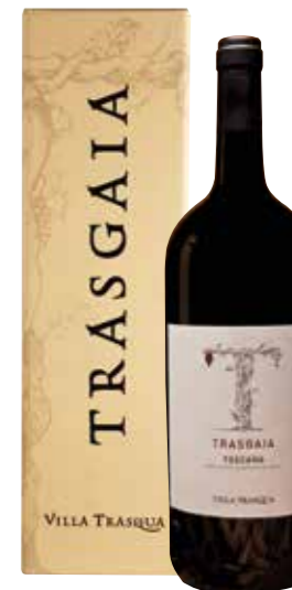
Villa Trasqua Trasgaia Magnum in geschenkdoo

€ 59,50 pakketprijs excl. BTW € 72,00 pakketprijs incl. BTW