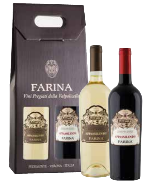
Farina Appassimento Bianco en Rosso del Veneto in geschenkdoos

€ 21,36 pakketprijs excl. BTW € 25,85 pakketprijs incl. BTW