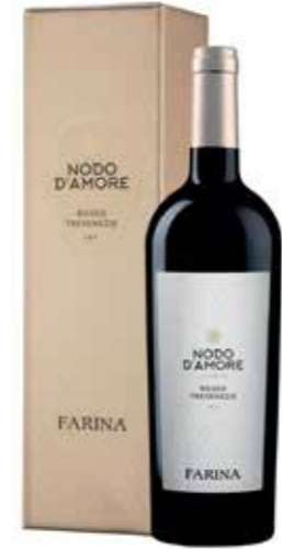
Farina Nodo d'Amore Rosso in geschenkdoos

€ 15,62 pakketprijs excl. BTW € 18,90 pakketprijs incl. BTW