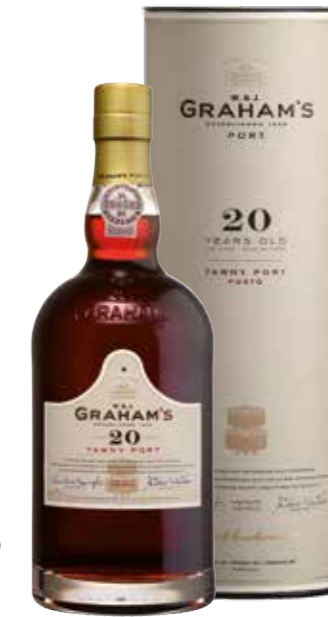
Graham's 20 Years Old Tawny 75 cl in tube

€ 37,15 pakketprijs excl. BTW € 44,95 pakketprijs incl. BTW