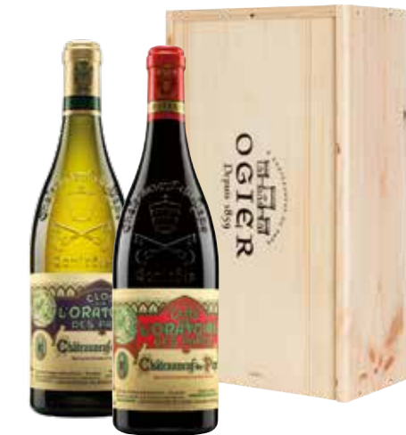
Ogier Clos de l'Oratoire des Papes Blanc en Rouge in houten kist

€ 75,21 pakketprijs excl. BTW € 91,00 pakketprijs incl. BTW