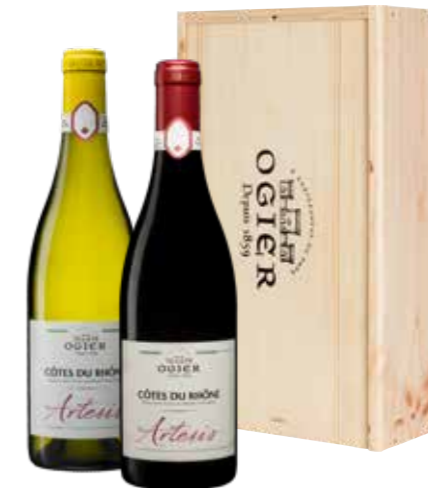
Ogier Artésis Blanc en Rouge in houten kist

€ 24,71 pakketprijs excl. BTW € 29,90 pakketprijs incl. BTW