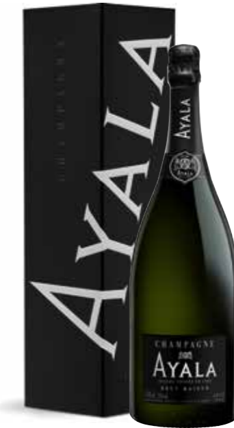
Ayala Brut Majeur Magnum 150 cl. in geschenkdoos

€ 70,17 pakketprijs excl. BTW € 84,90 pakketprijs incl. BTW