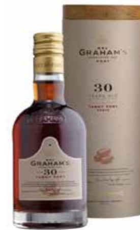
Graham's 30 Years Old Tawny 20 cl in tube

€ 24,75 pakketprijs excl. BTW € 29,95 pakketprijs incl. BTW