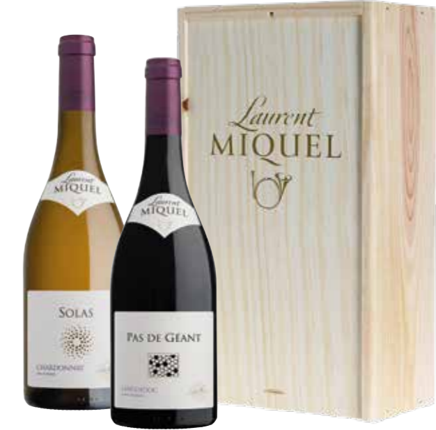
Laurent Miquel Solas Chardonnay en Pas de Géant in houten kist

€ 23,06 pakketprijs excl. BTW € 27,90 pakketprijs incl. BTW