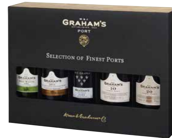
Graham's Selection gift pack 20 cl: Fine White, Late Bottled Vintage, Six Grapes, 10 Years Old en 20 Years Old Tawny Port

€ 35,50 pakketprijs excl. BTW € 42,95 pakketprijs incl. BTW