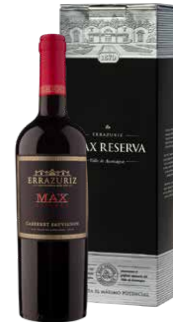
Errázuriz Max Reserva Cabernet Sauvignon in geschenkdoos

€ 14,42 pakketprijs excl. BTW € 17,45 pakketprijs incl. BTW