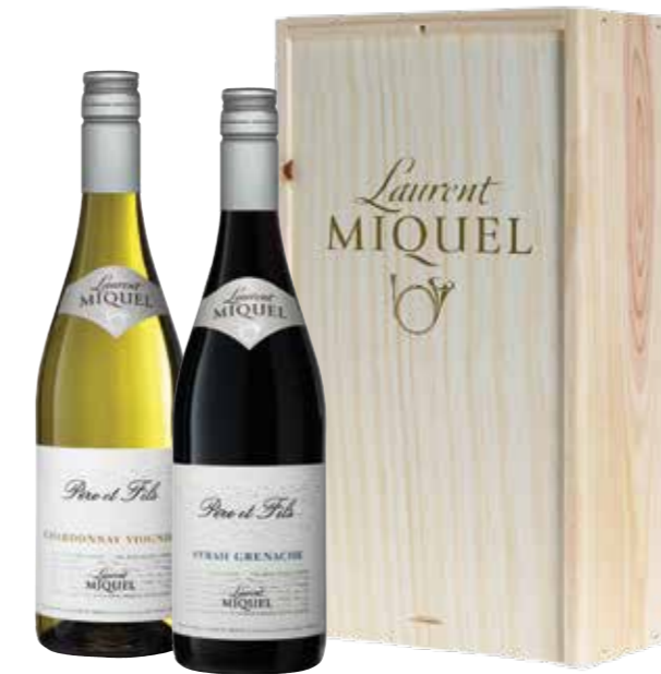
Laurent Miquel Père et Fils Chardonnay-Viognier en Syrah-Grenache in houten kist

€ 19,75 pakketprijs excl. BTW € 23,90 pakketprijs incl. BTW