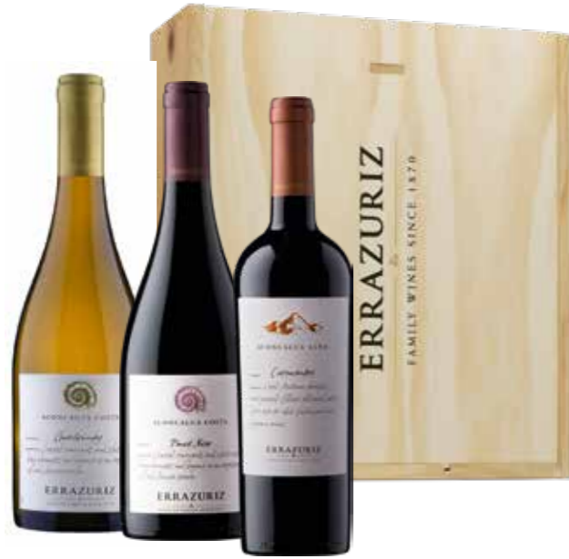
Errázuriz Aconcagua Costa Chardonnay, Pinot Noir en Carmenère in houten kist

€ 58,10 pakketprijs excl. BTW € 70,30 pakketprijs incl. BTW