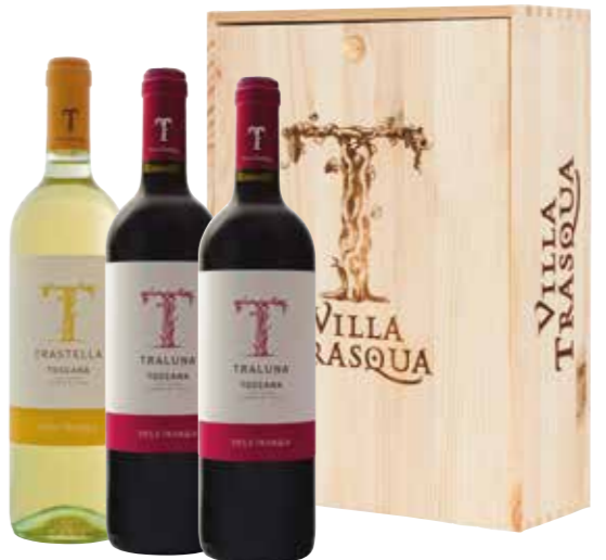
Villa Trasqua Trastella Vermentino en Traluna Sangiovese 3 flessen in houten kist

€ 35,37 pakketprijs excl. BTW € 42,80 pakketprijs incl. BTW