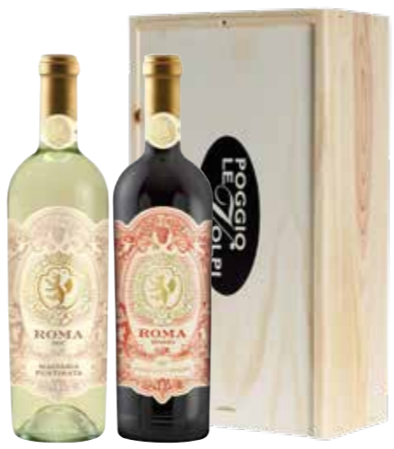
Poggio Le Volpi Roma Bianco en Roma Rosso in houten kist

€ 34,63 pakketprijs excl. BTW € 41,90 pakketprijs incl. BTW