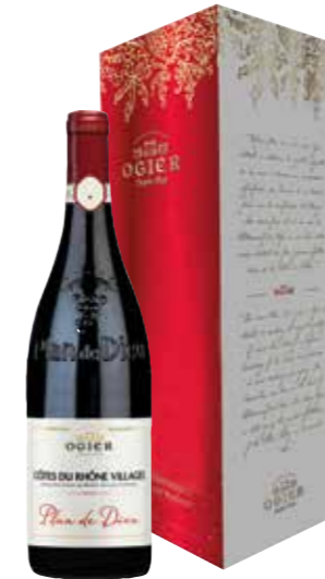
Ogier Côtes du Rhône Villages Plan de Dieu in geschenkdoos

€ 14,42 pakketprijs excl. BTW € 17,45 pakketprijs incl. BTW