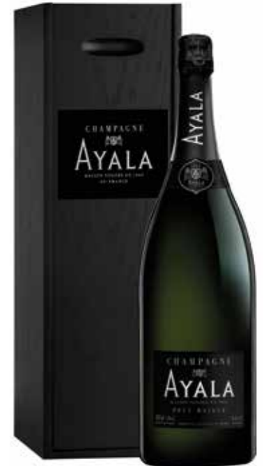
Ayala Brut Majeur Jeroboam 300 cl. in geschenkdoos

€ 144,63 pakketprijs excl. BTW € 175,00 pakketprijs incl. BTW