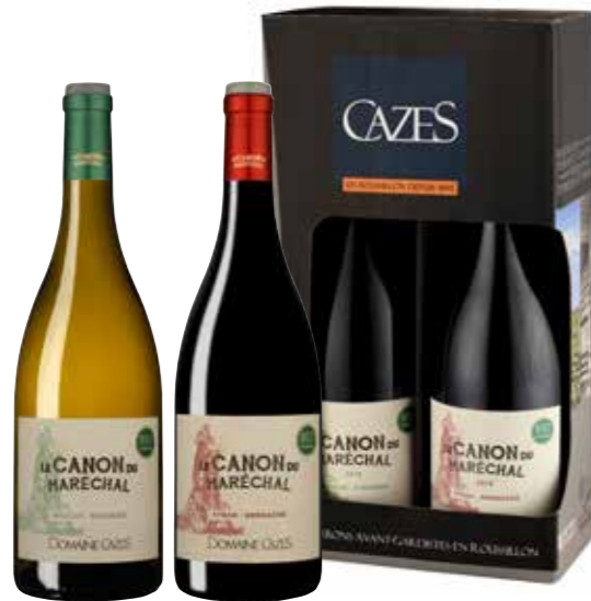
Cazes BIO Le Canon du Maréchal Muscat-Viognier en Syrah-Grenache in geschenkdoos

€ 22,23 pakketprijs excl. BTW € 26,90 pakketprijs incl. BTW