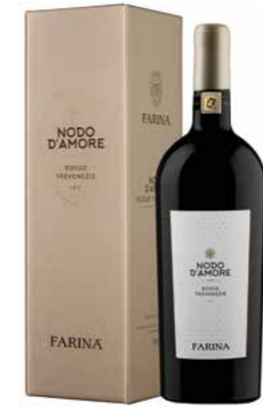
Farina Nodo d'Amore Rosso Magnum 150 cl. in geschenkdoos

€ 32,19 pakketprijs excl. BTW € 38,95 pakketprijs incl. BTW