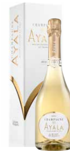
Ayala Blanc de Blancs 2012 in geschenkdoos

€ 49,59 pakketprijs excl. BTW € 60,00 pakketprijs incl. BTW