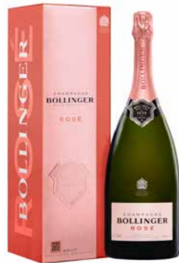
Bollinger Rosé Magnum 150 cl. in geschenkdoos

€ 106,61 pakketprijs excl. BTW € 129,00 pakketprijs incl. BTW