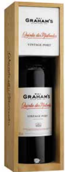
Graham's Quinta dos Malvedos Vintage Port in houten kist

€ 37,15 pakketprijs excl. BTW € 44,95 pakketprijs incl. BTW