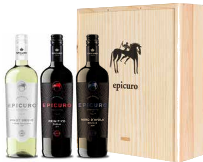
Epicuro Pinot Grigio, Primitivo Puglia en Nero d'Avola in houten kist

€ 28,88 pakketprijs excl. BTW € 34,95 pakketprijs incl. BTW