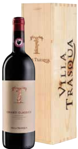
Villa Trasqua Chianti Classico in houten kist

€ 20,04 pakketprijs excl. BTW € 24,25 pakketprijs incl. BTW