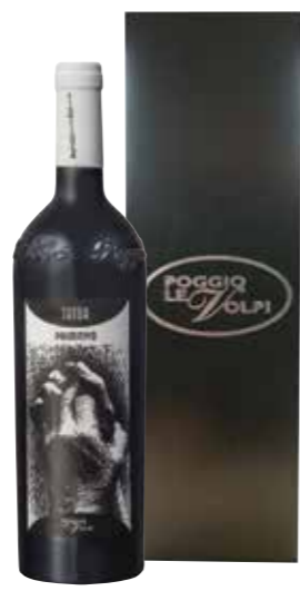
Poggio Le Volpi Tator Primitivo Magnum in kist

€ 42,07 pakketprijs excl. BTW € 50,90 pakketprijs incl. BTW