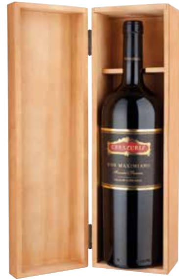
Don Maximiano Founder's Reserve in luxe houten kist

€ 55,79 pakketprijs excl. BTW € 67,50 pakketprijs incl. BTW