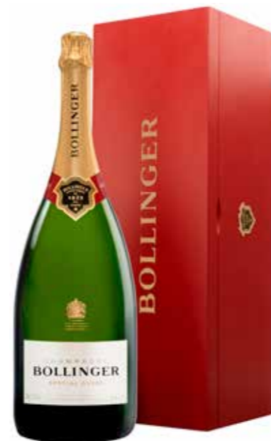
Bollinger Special Cuvée Brut Jeroboam 300 cl. in houten kist

€ 202,48 pakketprijs excl. BTW € 245,00 pakketprijs incl. BTW