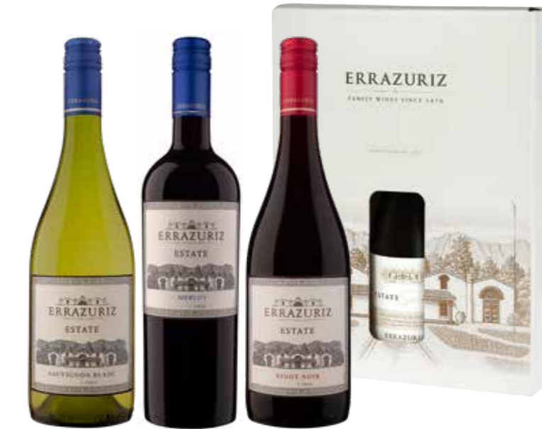
Errázuriz Estate Series Sauvignon Blanc, Pinot Noir en Merlot in geschenkdoos

€ 27,93 pakketprijs excl. BTW € 33,80 pakketprijs incl. BTW