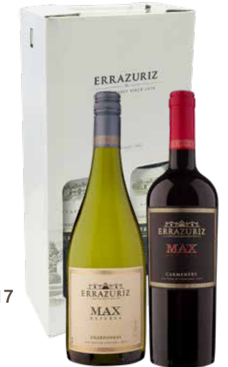
Errázuriz Max Reserva Chardonnay en Carmenère in geschenkdoos

€ 26,78 pakketprijs excl. BTW € 32,40 pakketprijs incl. BTW