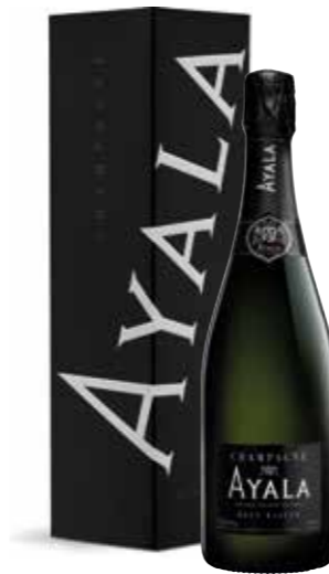
Ayala Brut Majeur in geschenkdoos

€ 33,02 pakketprijs excl. BTW € 39,95 pakketprijs incl. BTW